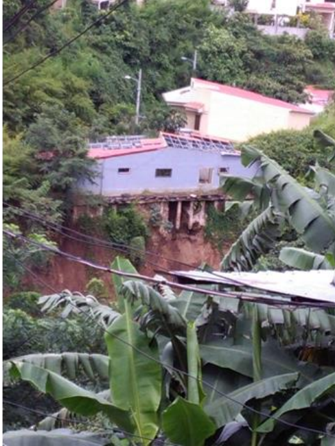
Figura 4. Casas de gran valor frente a calles de adoquín del sector Bosques de Moravia.