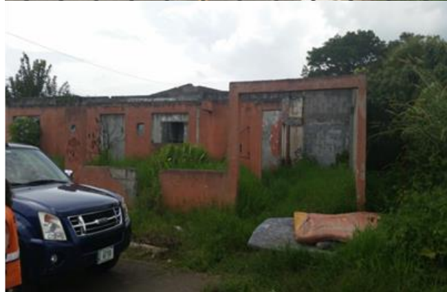
Figura 2. Condominio Natalia (foto arriba). Frente al condominio hay otras casas abandonadas, afectadas por el deslizamiento del terreno (foto abajo).