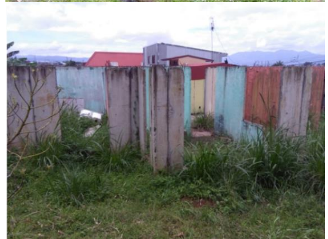
Figura 1. Obra de mitigación y afectación de vivienda por inadecuadas condiciones del suelo.