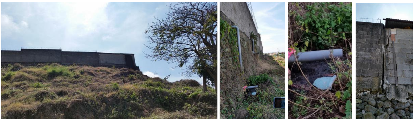
Figura 3. Urbanización El Paseo II y daños en viviendas. Foto izquierda: pendiente del terreno en la parte trasera de la urbanización. Foto derecha: Agrietamientos en el límite de las casas última y penúltima del residencial. Fotos centrales: eliminación de aguas residuales en la base del muro de gaviones sobre el que se apoya la tapia de las viviendas. Ablandamiento del suelo y formación de lodo a consecuencia de la eliminación de aguas residuales.

Recordemos que la mala canalización de aguas ha generado hundimientos del terreno y serios problemas en vías públicas de Costa Rica. Dos casos que merecen mención son los hundimientos del terreno en la autopista General Cañas, a la altura del Residencial Los Arcos, cantón Belén, provincia Heredia y otro en la Ruta de Circunvalación cerca de Hatillo. El primero ocurrió en junio del 2012 y el segundo en agosto de 2013. En ambos casos el agua socavó el suelo alrededor de alcantarillas y propició el colapso de las vías.